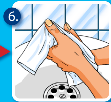
6. Hände abtrocknen