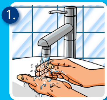
1. Hände nass machen