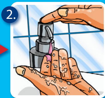
2. Flüssigseife dazu geben