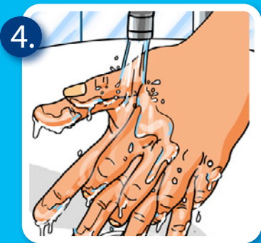
4. Hände gründlich abspülen